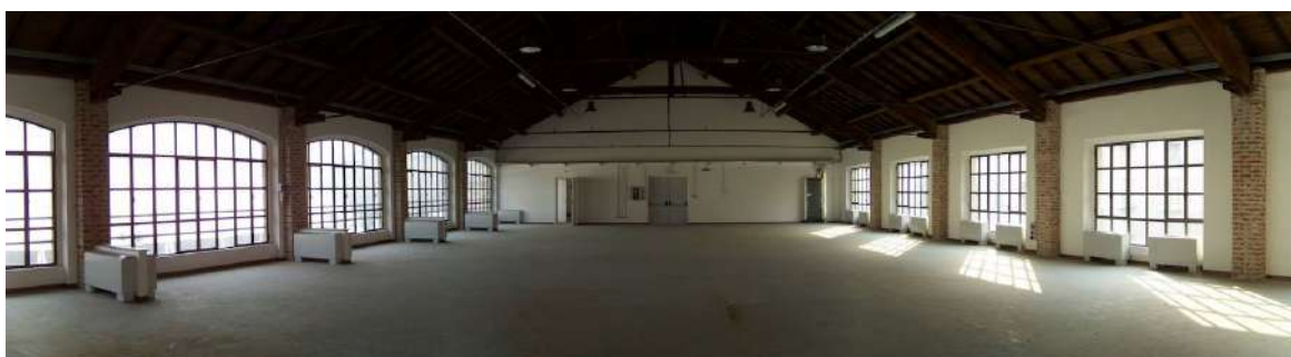
Fabbrica del Vapore Lotto 15 Via Giulio Cesare Procaccini, 4, 20154 Milano MI MM5 Cenisio/Monumentale Tram 12/14 Fermata Bramante/Monumentale

Entrambi i luoghi hanno il pregio di trovarsi nei pressi di fermate della Metropolitana. Lo spazio della Fabbrica del Vapore, inoltre, permette l'arrivo di pullman e lo sbarco delle scolaresche in tutta sicurezza all'interno del cortile della struttura.