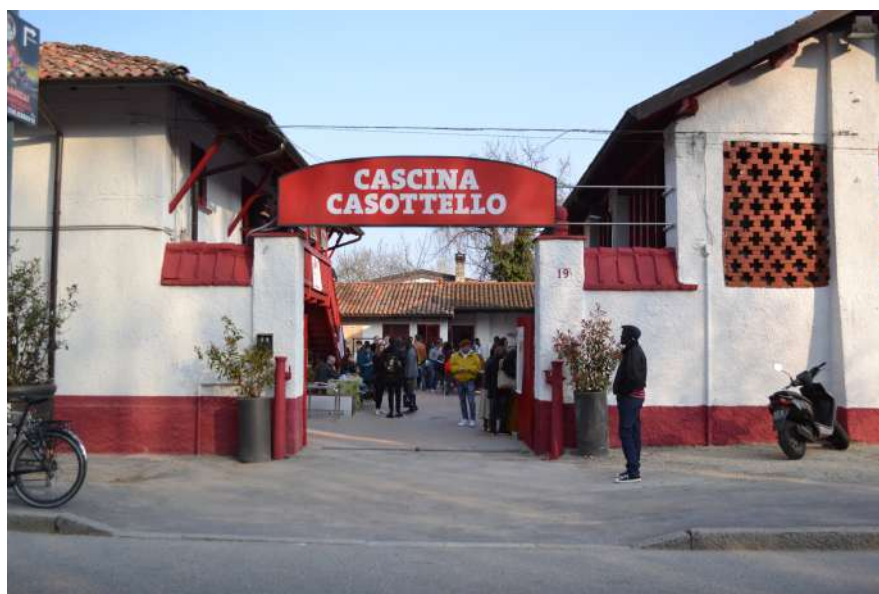
Cascina Casottello MM3 Porto di Mare