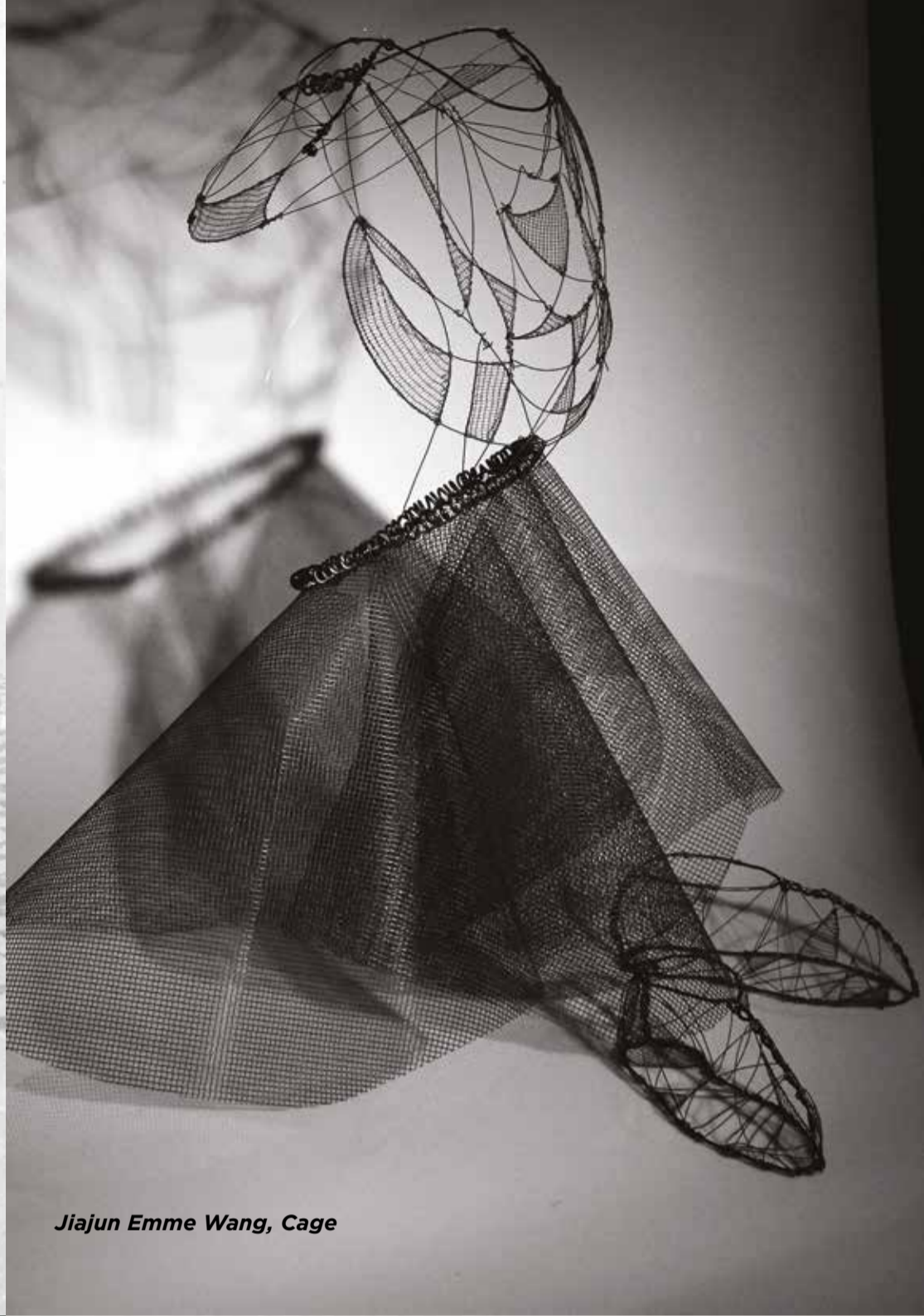
Jiajun Emme Wang, Cage