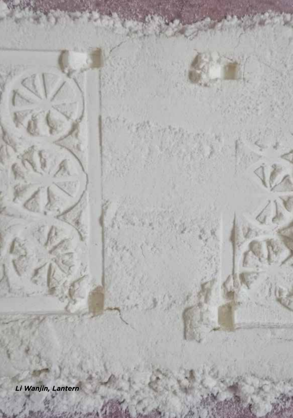
Li Wanjin, Lantern