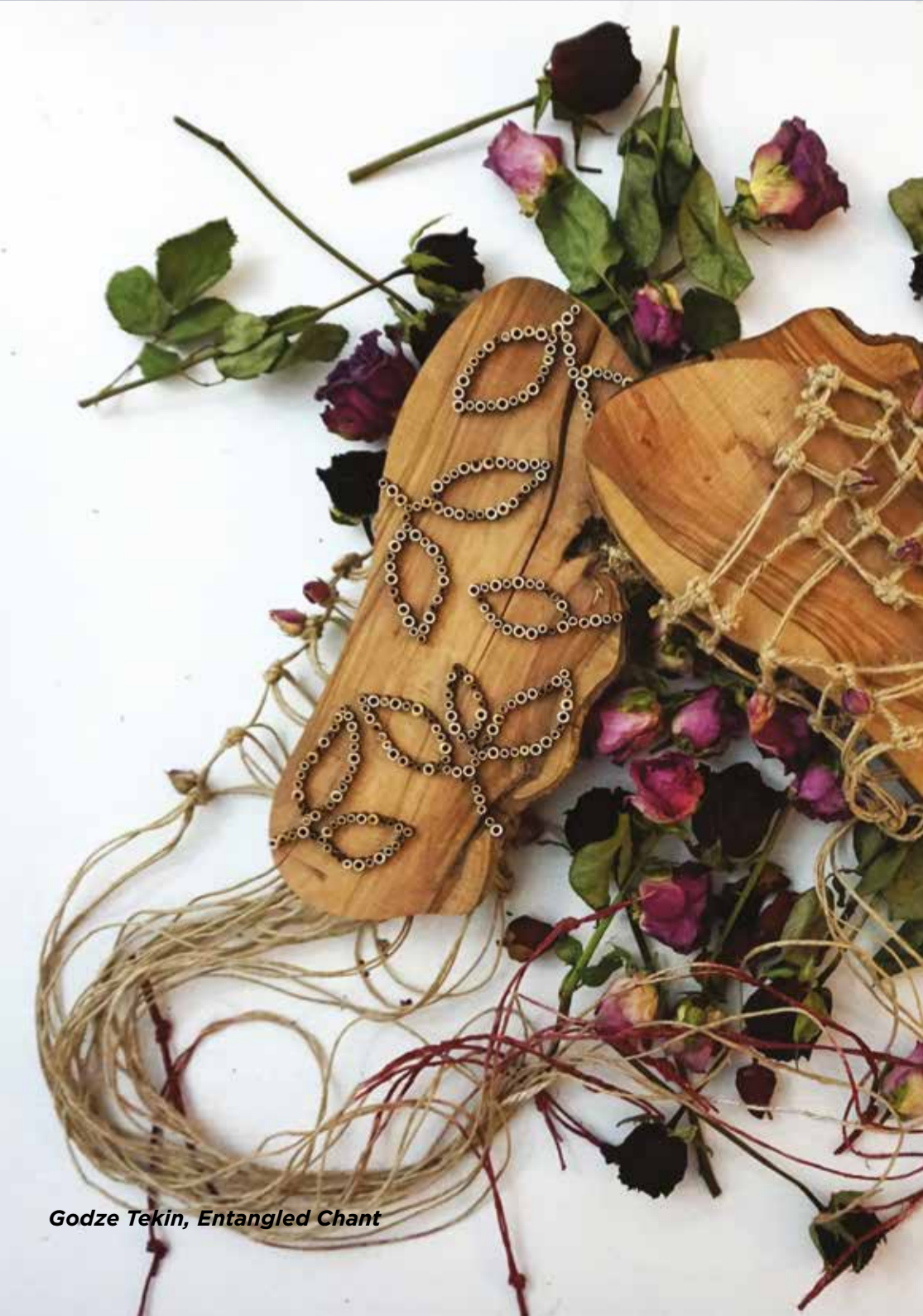
Godze Tekin, Entangled Chant