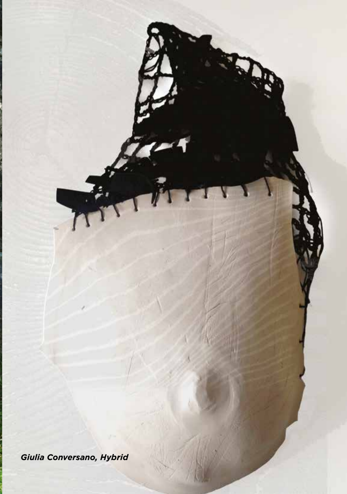
Giulia Conversano, Hybrid